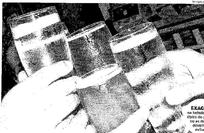
EXAGERO na bebida, seja a típica do período ou as demais, devem ser evitados

Além de acordo com o médico, o álcool é uma constante na vida de população brasileira, como aponta uma pesquisa realizada recentemente por uma renomada universidade nacional. O resultado afirmou ao mesmo que o brasileiro bebe, em média, 3,5 litros de álcool anualmente, cenário que remete, na opinião do psiquiatra, às ocasiões festivas existentes no calendário local, sobretudo por uma cultura entrançada de que o álcool apresenta uma saída legal existente no indivíduo, que gera, automaticamente, uma quantidade de in-