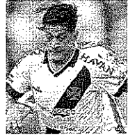
Cano acredita na evolução do time

Para essa partida, o técnico Abel Braga tem somente uma dúvida na