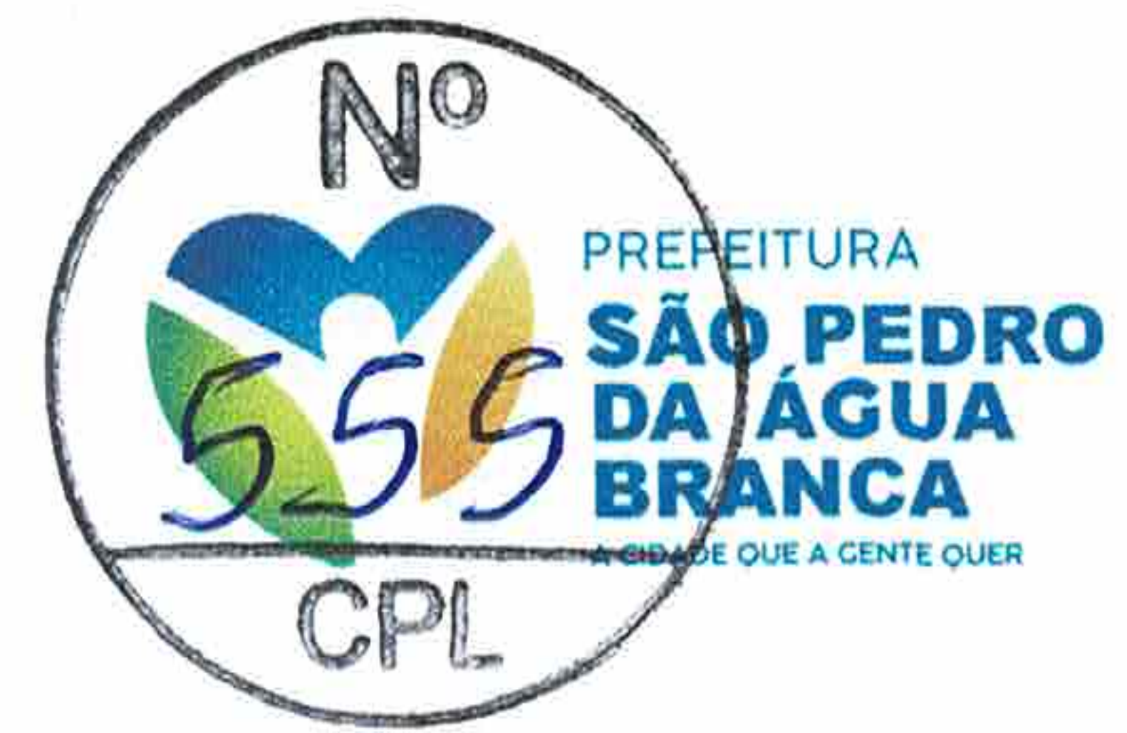
ALEXSANDRO TENÓRIO ROLIM Pregoeiro Municipal