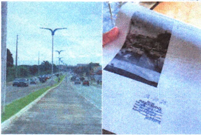
Fim da faixa exclusiva para ônibus foi pedido à MOB, por meio de um abaixo-assinado, elaborado pelos moradores

Lucas informou que foi criado um abaixo-assinado pedindo modificações na MA-203. Pelo menos 1.500 moradores do Araçagi assinaram o documento, solicitando à Agência de Mobilidade Urbana (MOB), que faça modificações na rodovia estadual, que foi projetada para receber o BRT. Na petição, os moradores solicitam que a pista central onde transitam ônibus, que seria para o BRT, seja relocalizada na via da direita. A justificativa é que os ônibus