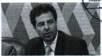
Adolfo Sachsida falou sobre imunidade de rebanho para Guedes

Em novembro do ano passado, Sachsida afirmou que "vários esta-