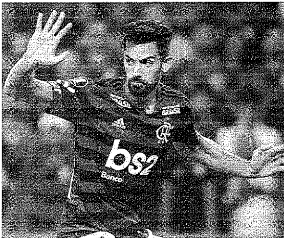
Marí chegou em julho ao Flamengo, estreando contra o Botafogo pelo Campeonato Brasileiro 2019

Gustavo Henrique foi contratado para o zaga