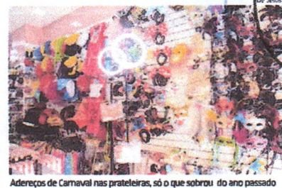
Adereços de Carnaval nas prateleiras, só o que sobrou do ano passado

olina este ano e por duas o valor do litro do diesel. Desde o início do ano, a Petrobras já elevou em 22% o preço da gasolina e em dezembro, o litro custava R$ 1,84. Já o diesel subiu 10,9%. Com as novas altas, o litro da gasolina passou a custar mais caro que o do diesel a distribuidoras. ■