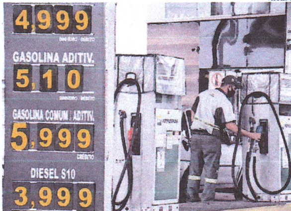
Aumento no preço da gasolina deixa motoristas de aplicativos preocupados e no prejuízo com suas corridas

Com o aumento da gasolina, motoristas de aplicativos que alugam veículos para trabalhar se prejudicam e, não tendo como arcar com os custos do aluguel, ficando in-